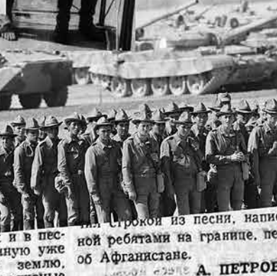
и в горах, сопках и в пес- ной ребятами на границе. пе- ных. Глядя на выжженную уже с весны афганскую землю.

изменил Афганистан немного, продолж А. ПЕТРОВ